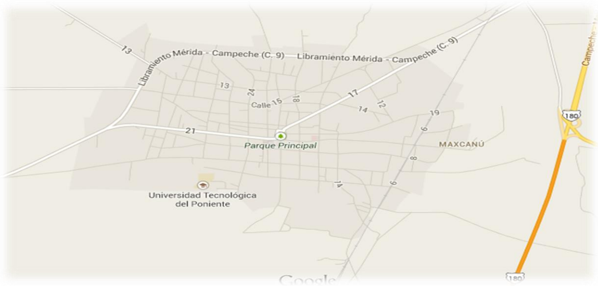
Figura 21 Ubicación geográfica del Municipio de Maxcanú

Con la declinación de la agroindustria se dio en Maxcanú un proceso de diversificación de la actividad agrícola. Hoy en el territorio municipal se cultiva principalmente maíz, frijol y hortalizas.